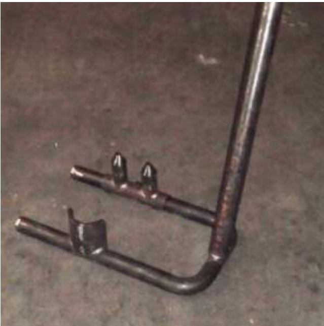
Achsgestell für Lackieranlage