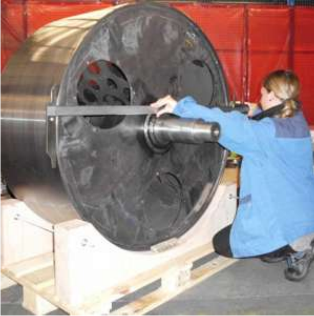
Rolle für Leistungsprüfstand