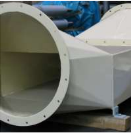
Große Trichter, Absaughauben und Schweißbaugruppen